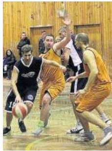
► Tak dynamicznych akcji w meczach CNBA nie brakuje

W pierwszej lidze trzy drużyny z grupy B zanotowały taki sam bilans i o końcowej pozycji przed play off zdecydowa-